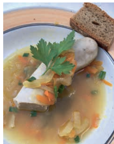
Blauer Zipfel in Restaurant Eule

Ook alle grote dirigenten van Levi, Mottl, Hans Richter en Richard Strauss tot aan onze tijd waren er te gast.