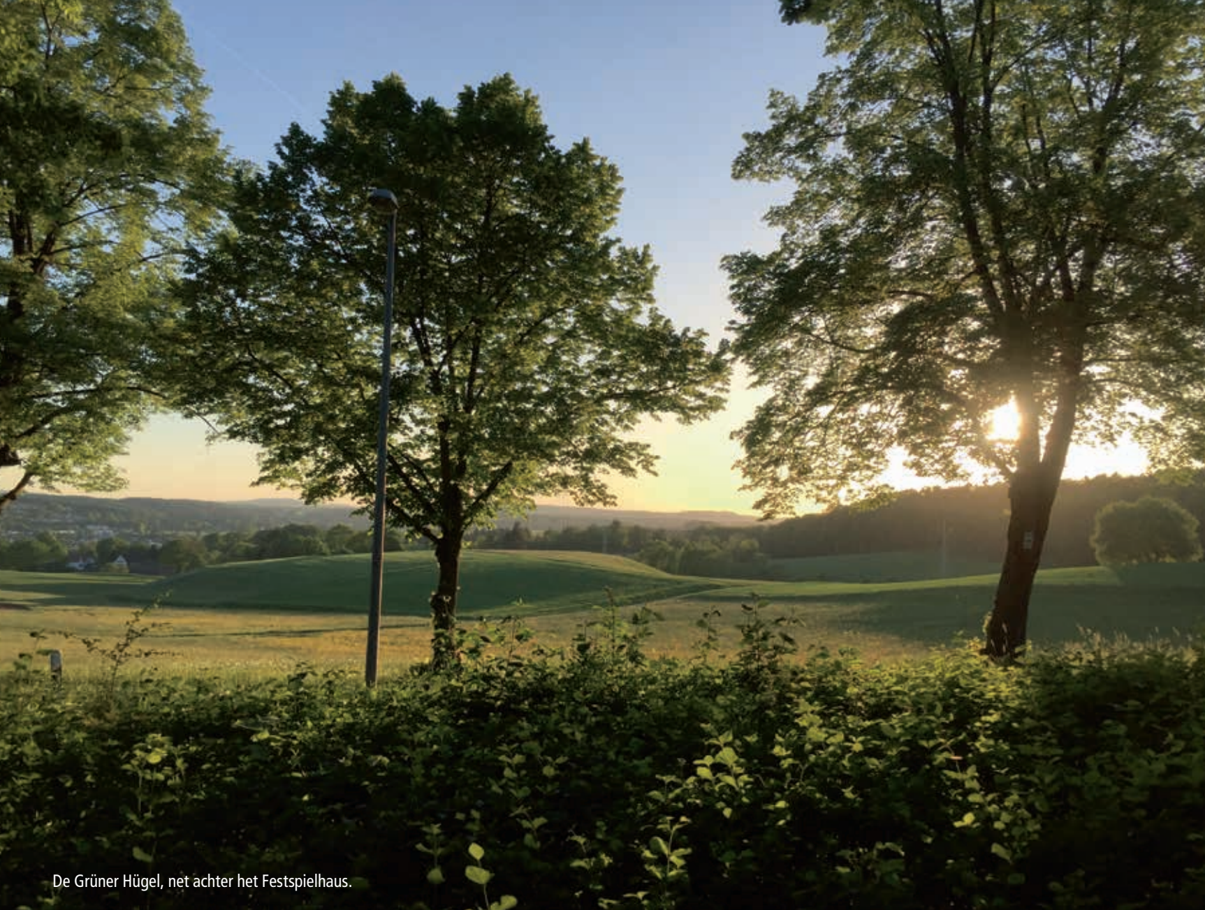
De Grüner Hügel, net achter het Festspielhaus.