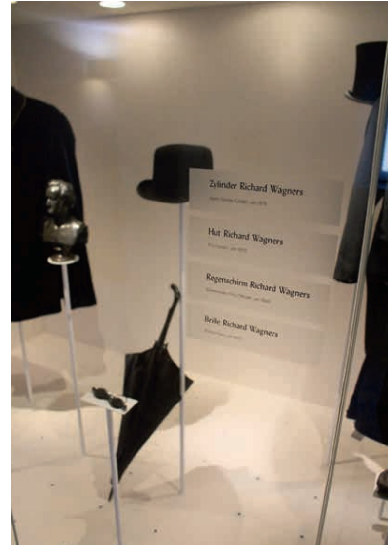
Expositie in de Villa Wahnfried

In onze tijd is het Festspielhaus, door Richard Wagner zelf ontworpen speciaal voor de opvoering van zijn eigen opera's, toch wel Bayreuths grootste blikvanger, ook al ontbreekt de pracht en praal van de operahuizen van bijvoorbeeld Parijs of Wenen volledig. Tijdens de rondleiding wordt duidelijk dat de term Wagnerianen wel passend is voor het publiek dat hier, tegen entreeprijzen van honderden euro's, hartje zomer bij extreme temperaturen van soms tegen de veertig graden, op niet al te gemakkelijke stoeltjes bij aanzienlijke geluidsniveau's de muziek van de 'buikspreker van God' - zoals Martin van Amerongen Wagner noemde - wil ondergaan. Wagner