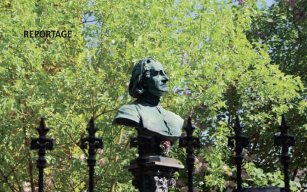
Buste van Franz Liszt voor zijn sterfhuis