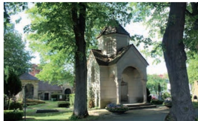
Het graf van Liszt